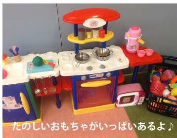
たのしいおもちゃがいっぱいあるよ!